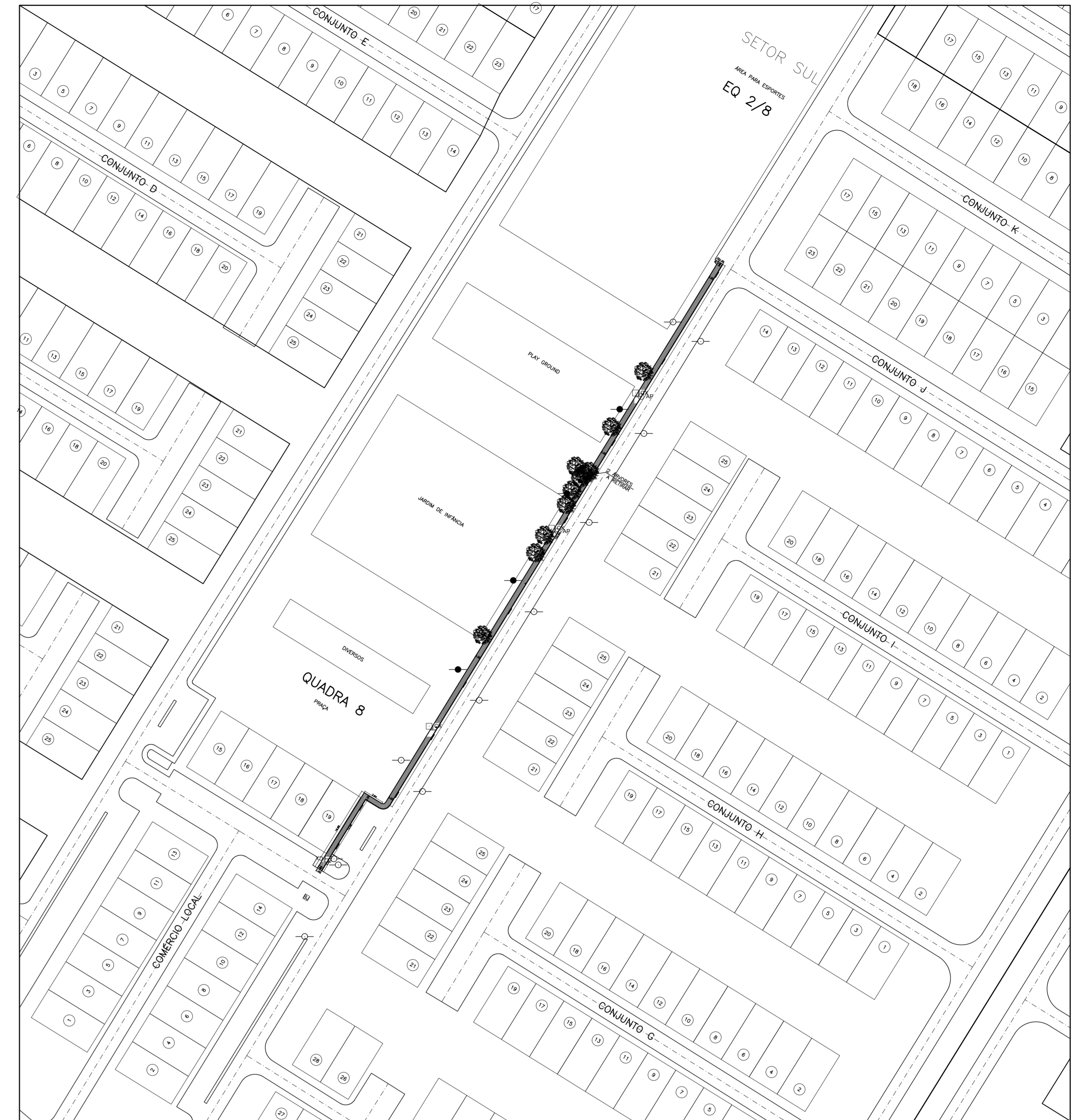
PLANTA DE SITUAÇÃO ESCALA: 1/5000